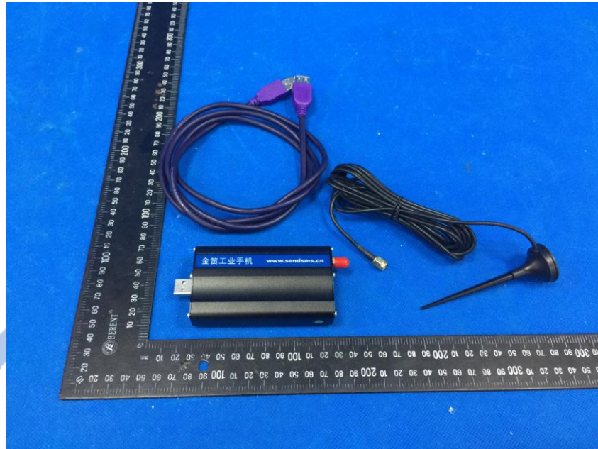
照片 1 正面

* * 结 束 * * 检验结论仅对送检样品有效； 未经本实验室书面同意，不得部分地复制本报告。